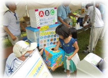
オリジナル缶バッジのプレゼント