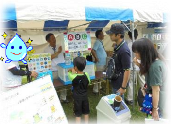
3種類の水の銘柄発表