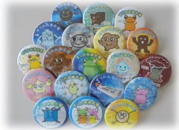
オリジナル缶バッジ