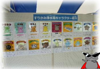
オリジナルキャラクターの紹介パネル