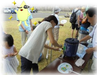
すりかみ浄水場の水の試飲