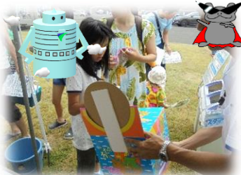
オリジナル缶バッジのプレゼント