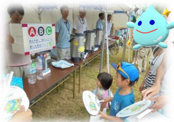
3種類の水の銘柄発表