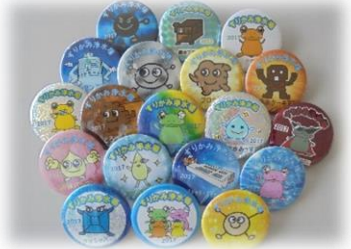
オリジナル缶バッジ